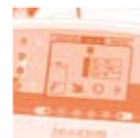
GROUPE ACTEON Implant Center et I-surge