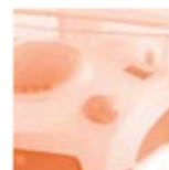
SATELEC Appareil d'endodontie