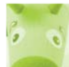
OUAPS ! Mini-golf Safari Aventure