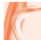
SATELEC Mini Led Auto Focus